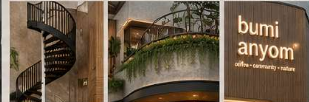
TANGGA SPIRAL IKONIK